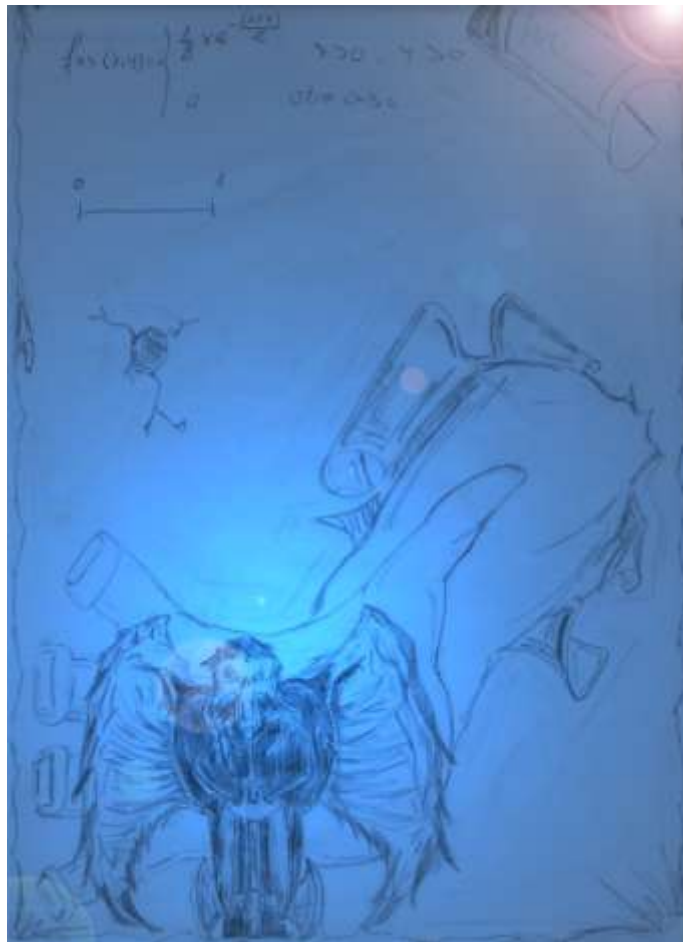
Ley y Trampa

Quien hizo la ley ya ves..., hizo la trampa, dime quién eres y te diré a quién espantas, dime a quién, cómo y cuándo el pan repartes y te diré cuánto hambre habrás pasado antes. Cuánto desplante, cuánto ignorante, mientras astuto arrima el saco para embolsarse lo que enganche.