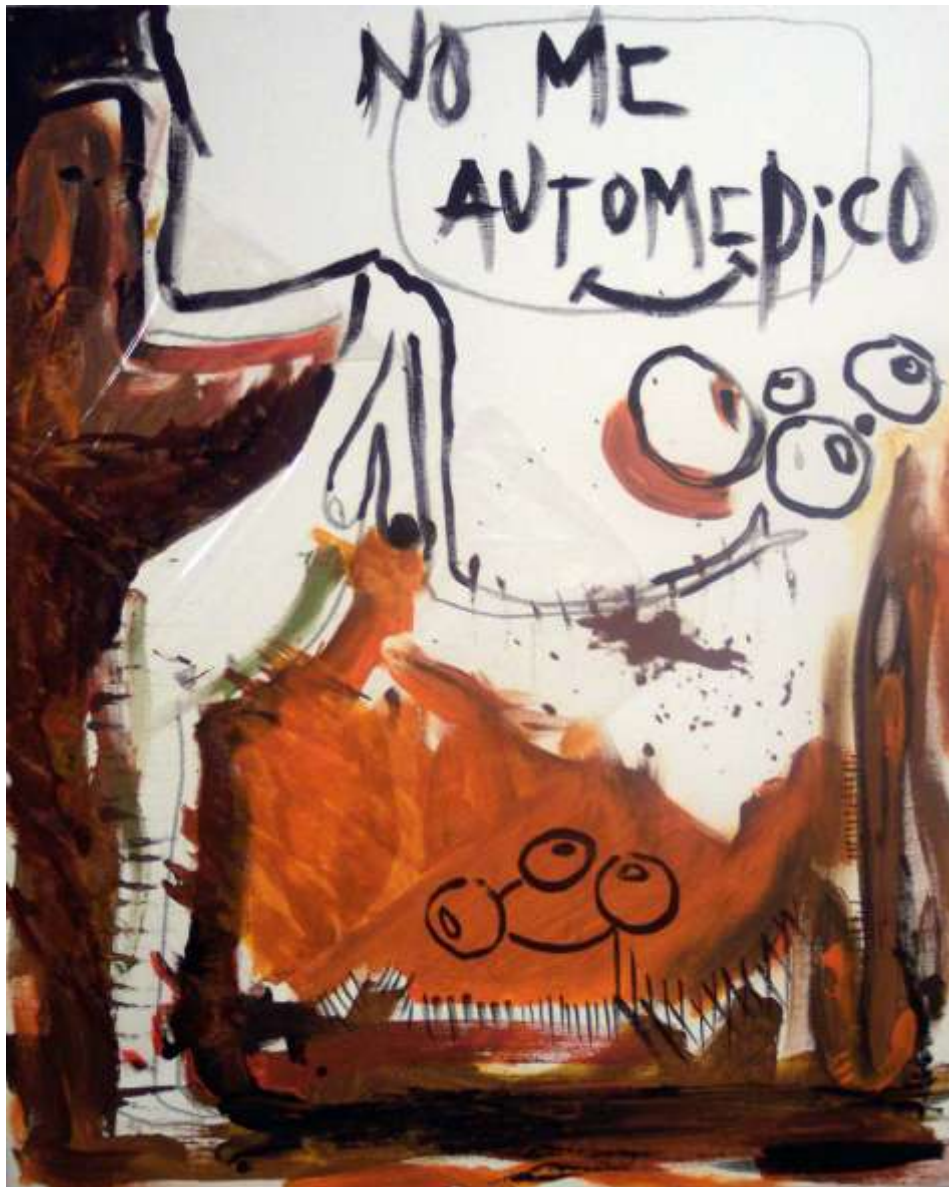
No me automedico

El día en que yo me canse de sonreír con mis gestos los desprecios, los olvidos, las provocaciones, los descuidos, no habrá pupila a mi paso