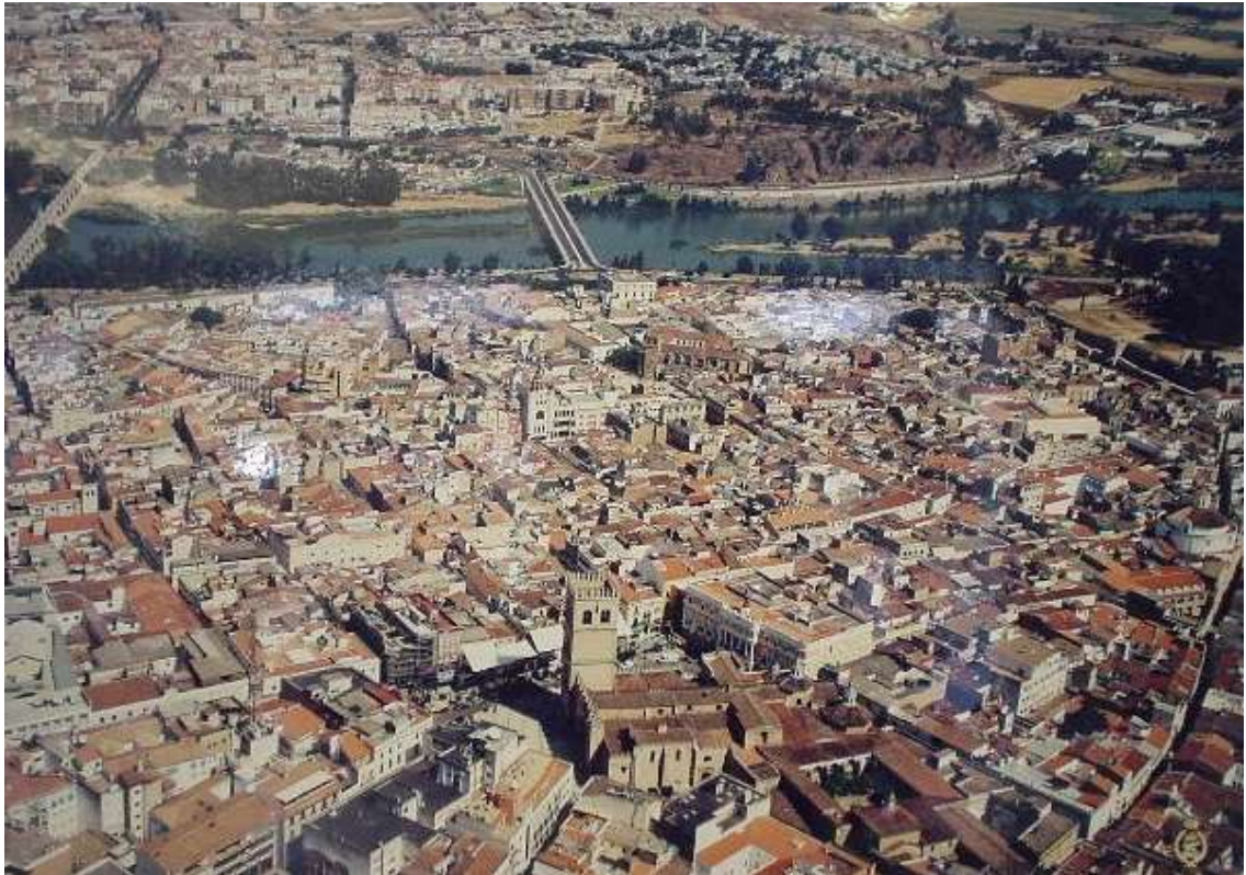
Vista aérea de Badajoz

¡No hay manera de hacer que la misma función empiece un día al revés! ¡No hay manera de ver a los mismos actores en distinto papel!